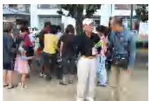
熊本シティFM一日密着取材

平成21年5月27日(水)にチャレンジデー2009を開催。自治会や学校・企業のみなさんの協力のおかげで多くの参加者がありました。ありがとうございました。